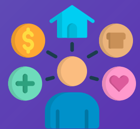
Recollida de necessitats