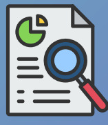
Diagnòstic de necessitats