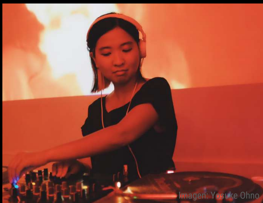
Imagen: Yosuke Ohno