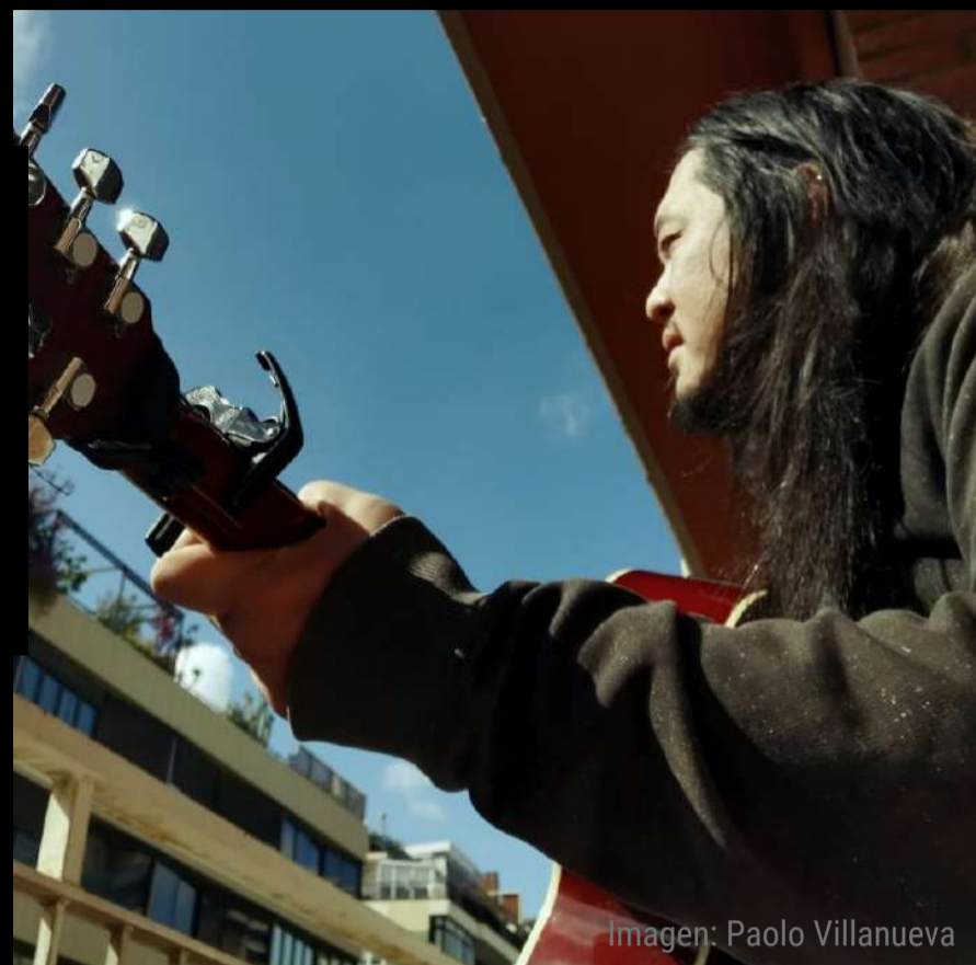
Imagen: Paolo Villanueva

Guitarrista de música ambiental / post-rock de Filipinas que usa acordes, ritmos y notas como letras, frases y párrafos para comunicar sentimientos a través de la música.