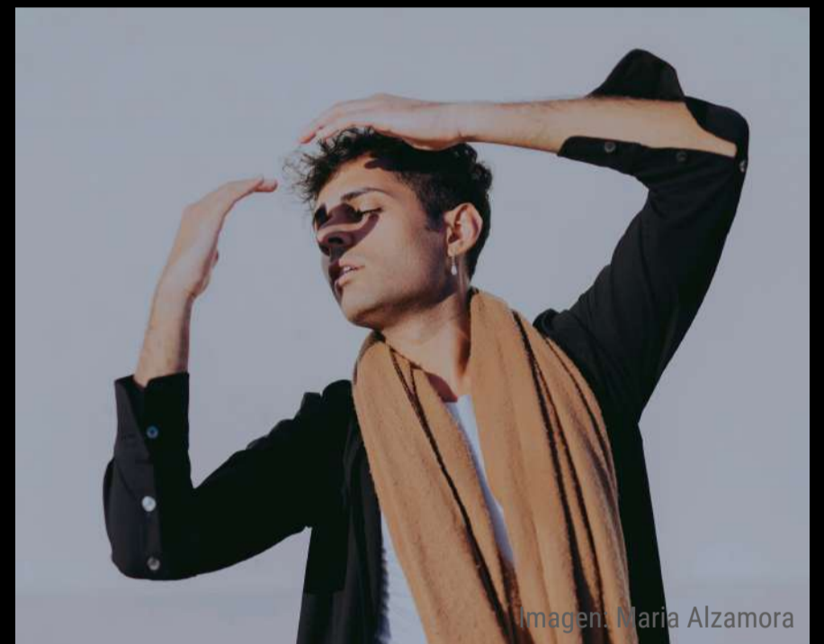
Imagen: María Alzamora

Piezas abstractas a voz y piano nacidas desde la improvisación, concebida esta como la única vía de creación disponible para uno a quien se le hizo creer que los del margen no crean, no firman, no tienen nada a decir.