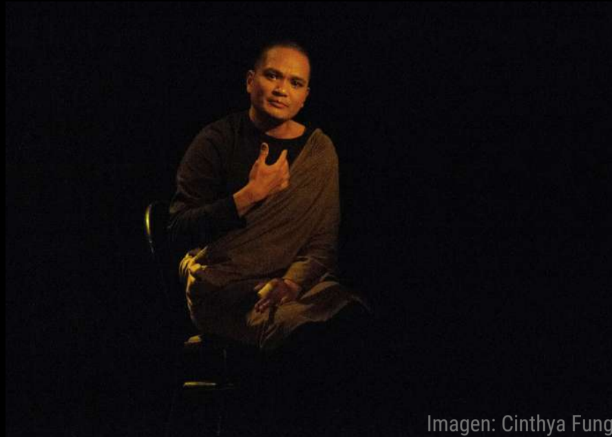
Imagen: Cinthya Fung

Director audiovisual, editor, guionista, ilustrador y dramaturgo afincado en Barcelona desde hace cuatro años. Es licenciado en Humanidades con estudios superiores en Comunicación Audiovisual.